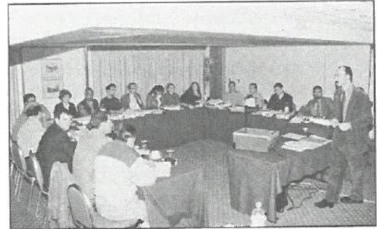
Κύπριοι Μηχανικοί ενημερώνονται για τις διεθνείς εξελίξεις στα συστήματα Πληροφοριών Γης σε σχέση με το Κτηματολόγιο.

Το Κέντρο Συνεχιζόμενης Εκπαίδευσης του Επιστημονικού Τεχνικού Επιμελητηρίου Κύπρου (ΕΤΕΚ) σε συνεργασία με το αντίστοιχο Κέντρο του Εθνικού Μετσόβιου Πολυτεχνείου και με την ενεργό συμμετοχή του Τμήματος Κτηματολογίου και Χωρομετρίας της Κύπρου, διοργάνωσε με επιτυχία τετραήμερο σεμινάριο με τίτλο "Κτηματολόγιο και Συστήματα Πληροφοριών Γης".