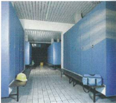
lockers for changing rooms