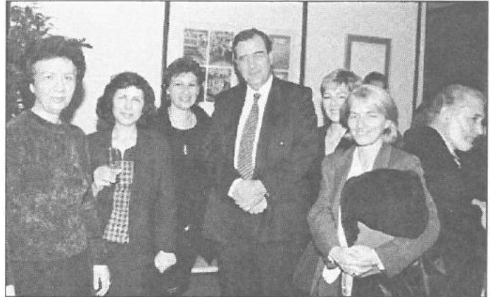
Αθρόα η προσέλευση στην δεξίωση του ΕΤΕΚ με την ευκαιρία του νέου χρόνου.

Εξώφυλλο: Το παραλιακό μέτωπο της Κάτω Πάφου.