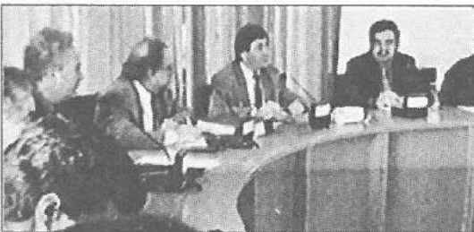
Από την συνάντηση Δημοτικού Συμβουλίου Πάφου, αντιπροσωπίας του ΕΤΕΚ και Επιστημονικών Οργανώσεων.

Η συνάντηση πραγματοποιήθηκε σε κλίμα αλληλοκατανόησης και συνεργασίας αποδεικνύοντας ότι, παρά τον κόπο και πόνο που προκάλεσε η έντονη αντιπαράθεση που είχε προηγηθεί, μέσα από τις νέες διαδικασίες και με πνεύμα ανοικτό είναι δυνατόν να προκύψουν αποφάσεις δημοκρατικές, κίως αποδεκτές.