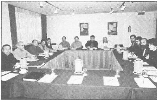
Από την συνεδρία της Επαρχιακής Επιστημονικής Επιτροπής Πάφου.

Πραγματοποιήθηκε στις 12 Φεβρουαρίου συνεδρία της Επαρχιακής Επιστημονικής Επιτροπής Πάφου στην οποία παρέστη κλιμάκιο της Διοικούσας Επιτροπής με επικεφαλής τον πρόεδρο του ΕΤΕΚ.