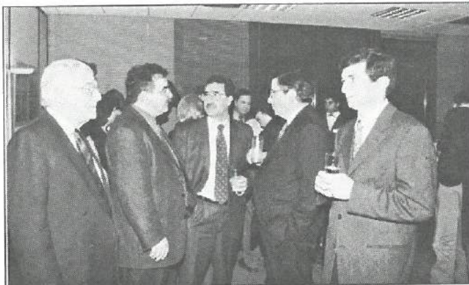
Πουργουρίδης: Εσσει κανέναν σκάνδαλο; Μεσαρίτης: Οί, πόψε έννεν ώρα για τέθκια.

Με την ευκαιρία του Νέου Χρόνου το Επιμελητήριο παρέθεσε δεξίωση στα γραφεία του στην οποία προσκλήθηκαν εκπρόσωποι της κυβέρνησης, της βουλής, των πολιτικών κομμάτων, των αρχών τοπικής αυτοδιοίκησης, των επιστημονικών οργανώσεων και αρκετοί συνάδελφοι. Στη δεξίωση παρευρέθησαν οι αξιωματούχοι και το προσωπικό του ΕΤΕΚ.